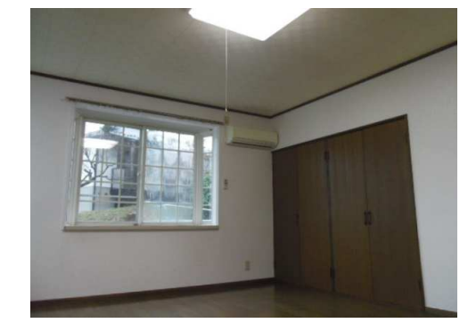
* 図面と現況に相違がある場合は現況を優先します。