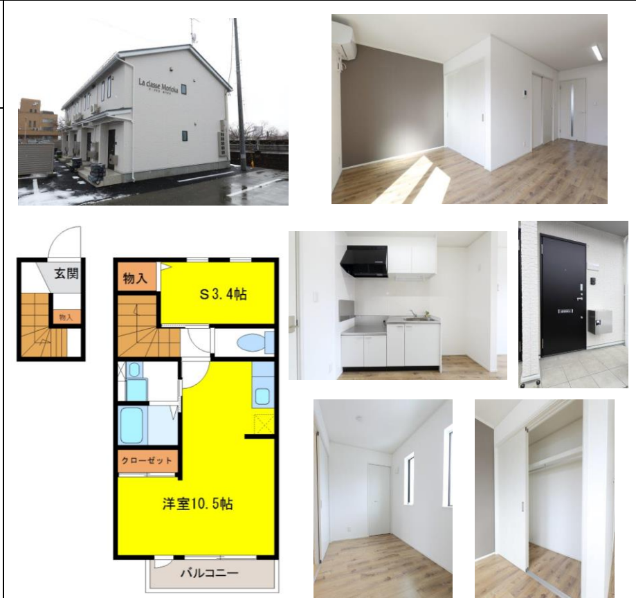
※図面・写真と現況に相違がある場合は現況を優先します。※室内写真はイメージです。