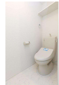
※図面・写真と現況に相違がある場合は現況を優先します。