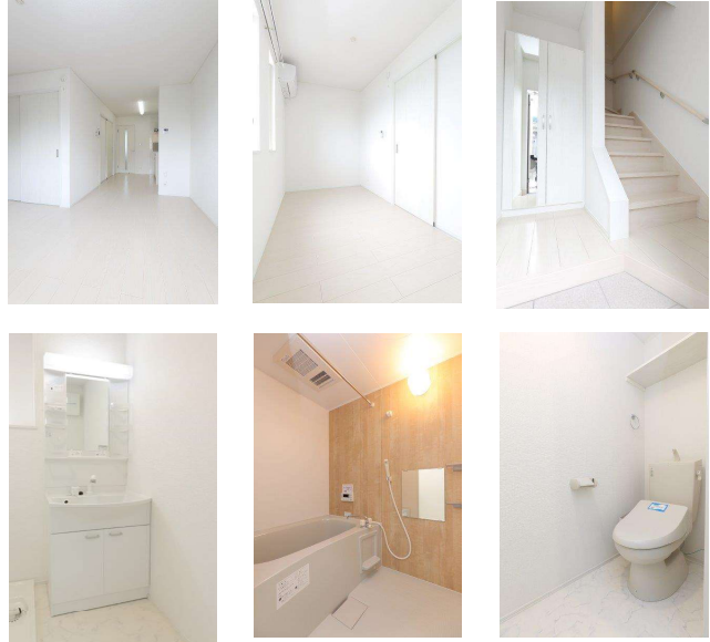
※図面・写真と現況に相違がある場合は現況を優先します。