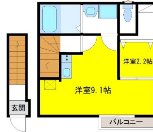
※図面・写真と現況に相違がある場合は現況を優先します。※室内写真はイメージです。