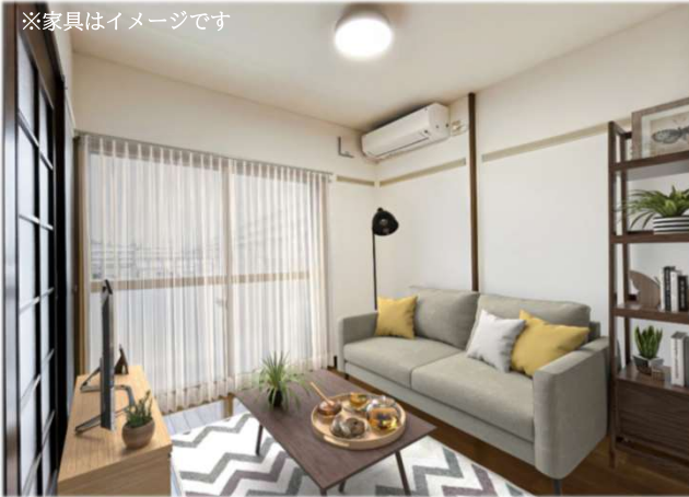
※家具はイメージです

インターネット無料・駐車場1台無料・宅配ボックス・IoTリモコン 徒歩圏内にはスーパー・コンビニがありお買い物にも便利です。