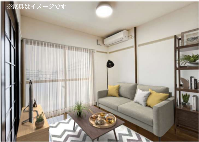
※家具はイメージです

インターネット無料・駐車場1台無料・宅配ボックス・IoTリモコン 徒歩圏内にはスーパー・コンビニがありお買い物にも便利で